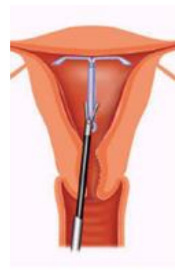
Figuur 5. Verwijderen van IUD waarvan touwtje niet te vinden is.

- Opheffen van geringe verklevingen in de baarmoederholte Dunne verklevingen tussen de voor- en achterwand zijn eenvoudig door te knippen. Voor dikkere en uitgebreide verklevingen (syndroom van Asherman) is een grotere operatie (therapeutische hysteroscopie) nodig (zie figuur 4).