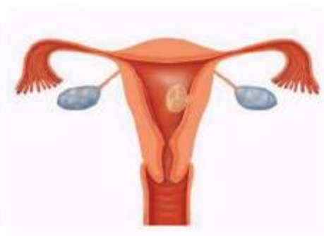
Figuur 3. Een myoom in de baarmoederholte kan door middel van een hysteroscopie worden gezien en verwijderd