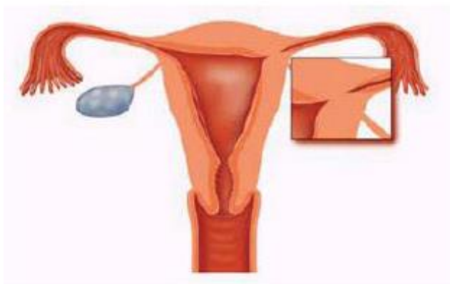
Figuur 4. Een verkleving in de eileiderhoek

- Opheffen van geringe verklevingen in de baarmoederholte Dunne verklevingen tussen de voor- en achterwand zijn eenvoudig door te knippen. Voor dikkere en uitgebreide verklevingen (syndroom van Asherman) is een grotere operatie (therapeutische hysteroscopie) nodig (zie figuur 4).