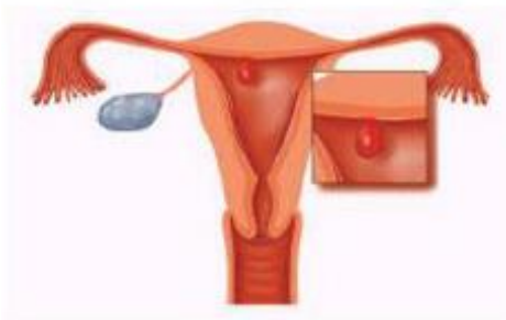
Figuur 2. Een poliep in de baarmoederholte kan door middel van hysteroscopie worden gezien en verwijderd